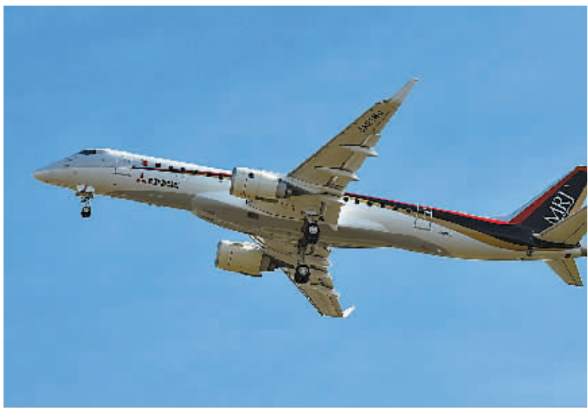
11月11日，在日本爱知县，日本第一款国产喷气式支线客机MRJ从名古屋机场起飞。

新华社供本报特稿(记者惠晓霜)日本第一款国产喷气式支线客机MRJ昨日完成首次试飞，向争夺全球市场迈出第一步。