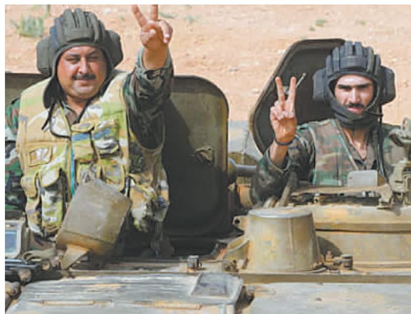
叙利亚政府军士兵做出胜利的手势。