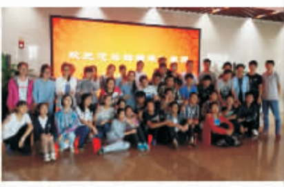
镇中学子走进镇海炼化