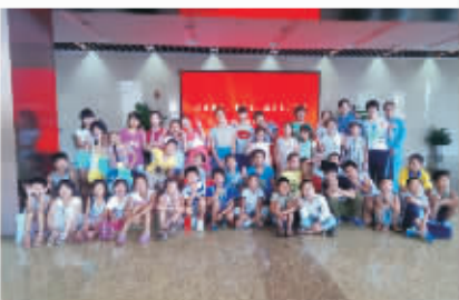
农民工子弟走进镇海炼化