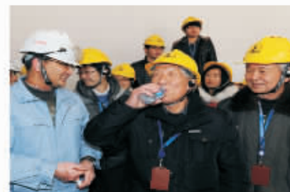
社区居民品尝处理后的纯净“废水”

2015年10月已举办了78期，累计接待公众代表超过3600人次，形成了政府、企业、公众三方良性互动的局面。