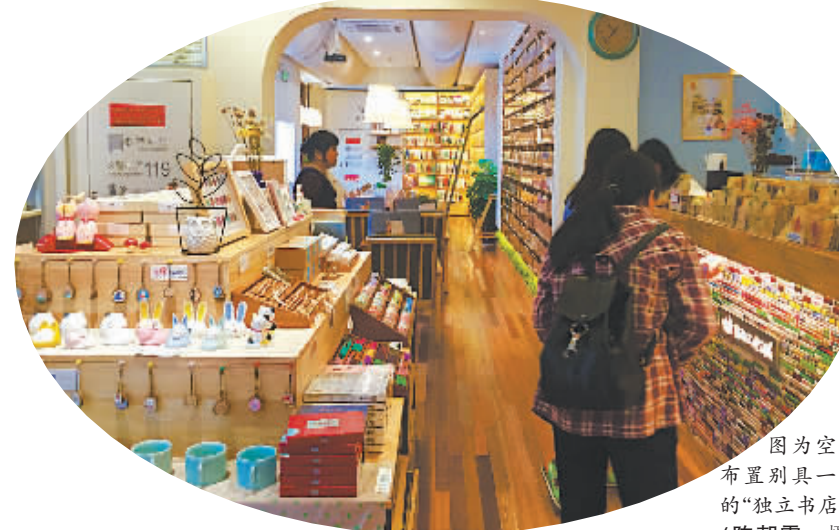
图为空间布置别具一格的“独立书店”。

这些“独立书店”有着共同的特点,位于人流量大的历史街区,或设在现代的城市时尚文化创意街区;书店内部区域的设置和装修让人眼前一亮——