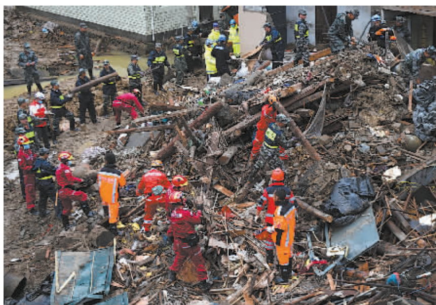
11月16日,救援人员在丽水市莲都区雅溪镇里东村山体滑坡灾害现场开展搜救工作。

新华社杭州11月16日电(记者方列 陈晓波)截至16日下午5时,浙江省丽水市莲都区里东村山体滑坡灾害发生接近72小时,现场搜救工作仍在全力进行中。根据掌握的情况,38名失联群众中,已搜救出27人,其中26人死亡,确认身份的17人,仍有11人失踪。由于救援现场开始降雨,发生次生灾害的可能增大,救援行动一度紧急终止。 16日下午4时10分左右,救援现场突然响起“全体紧急撤离”的高音喇叭呼叫声。滑坡现场上方部分松动的土层再次发生坍塌,救援工作一度中断。