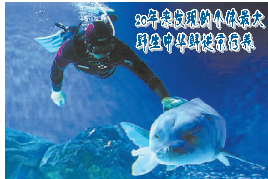
11月16日,潜水员在伴游刚入池的野生中华鲟,帮助它找到方向感。2014年11月15日,渔民在长江流域捕获巨型野生中华鲟,这尾中华鲟身体多处受伤、呈现失衡状态。当日晨,野生中华鲟进京前往北京海洋馆进行“疗养”。这尾中华鲟全长3.41米,体重310公斤,是近20年来发现的个体最大的野生中华鲟。

度、体制和机制。明确和强化企业的社会责任,保障公共安全和行业安全。在保障发展的基础上规范快递秩序,通过明确加盟经营双方权责,发挥法律责任机制对规范行业秩序的作用。 当下,我国快递业进入了转型发展期,快递条例出台正逢其时。面对新问题,需充分发挥法治的引领和规范作用,保障快递安全,保护用户合法权益。(据新华社北京11月16日电)