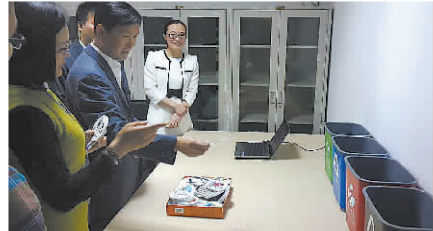
图为居民体验垃圾分类模拟厨房。

对大门的整面墙上被设计成了厨房图景,从左到右画有冰箱、水槽、组合式橱柜、燃气灶等。