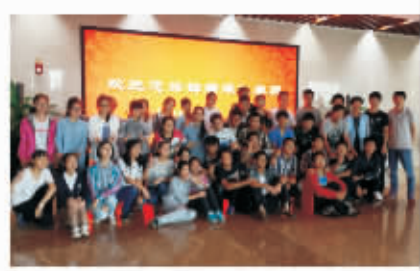
镇中学子走进镇海炼化