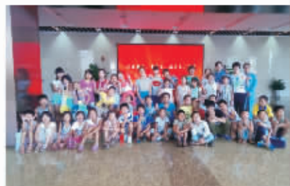
农民子弟走进镇海炼化