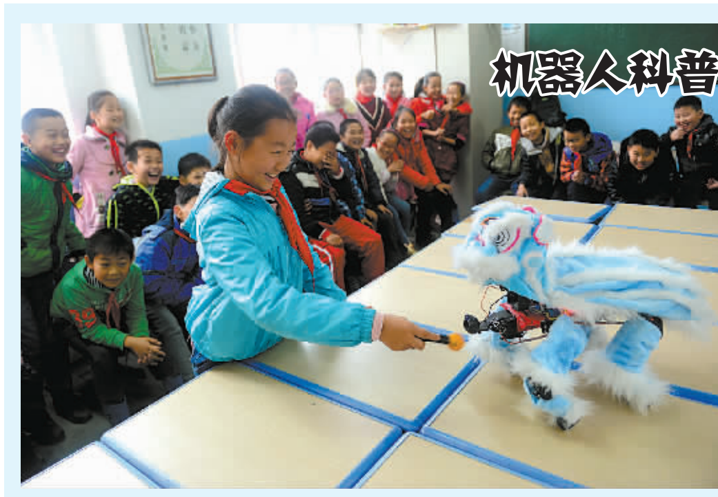
机器人科普进校园

会议指出,顺应新型城镇化发展要求,整合农村义务教育经费保障机制和城市义务教育奖补政策,建立统一的城乡义务教育经费保障机制,实现“两免一补”经费随学生流动可携带,是深化改革、推进基本公共服务均等化、促进社会公平迈出的新步伐。会议决定,一是从2016年春季学期开始,国家统一确定生均公用经费基准定额,对城乡义务教育学校(含民办学校)按不低于定额标准给予补助。适当提高寄宿制学校、北方取暖地区学校和规模较小学校补助水平。鼓励各地结合实际提高公用经费补助标准。二是从2017年春季学期开始,统一对城乡义务教育学生(含民办学校学生)免除学杂费,免费提供教科书、补助家庭经济困难寄宿生生活费。实施上述政策,由中央和地方统一分项目、按比例分担经费,明后年将新增财政投入150多亿元。