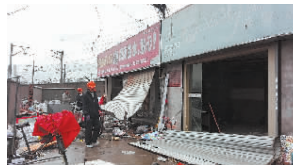
图为拆违现场。

该违建建筑共有14间,面积近1500平方米。上午9时半,记者看到,由于违建点就在铁路规划红线以内,旁边都是萧甬铁路的高压电缆,现场只能采用手工拆除的方式。工作人员介绍,预计本月底,该违建点可全部拆除完毕。