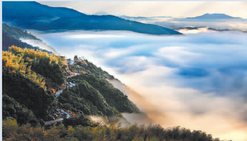
▲双峰山区雨后天晴,壮观的云海出现。