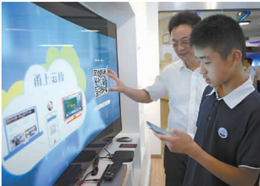
“甬上云校”为学生提供多种途径的学习方式。

——重点应用。深入推进重点应用系统建设，进一步拓展信息技术在民生、社会治理等领域的集成应用。按照“推广应用一批、续建完善一批、开工新建一批”的工作思路，以应用项目建设推动信息资源整合，带动产业发展，促进信息消费，力争智慧应用体系建设示范带动效应突出、重点应用效能显现。