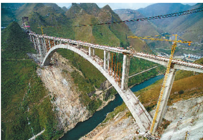
这是合龙后的沪昆高铁北盘江特大桥。

11月19日,位于贵州省安顺市境内的沪昆高铁北盘江特大桥顺利合龙。据介绍,北盘江特大桥由中国中铁港航