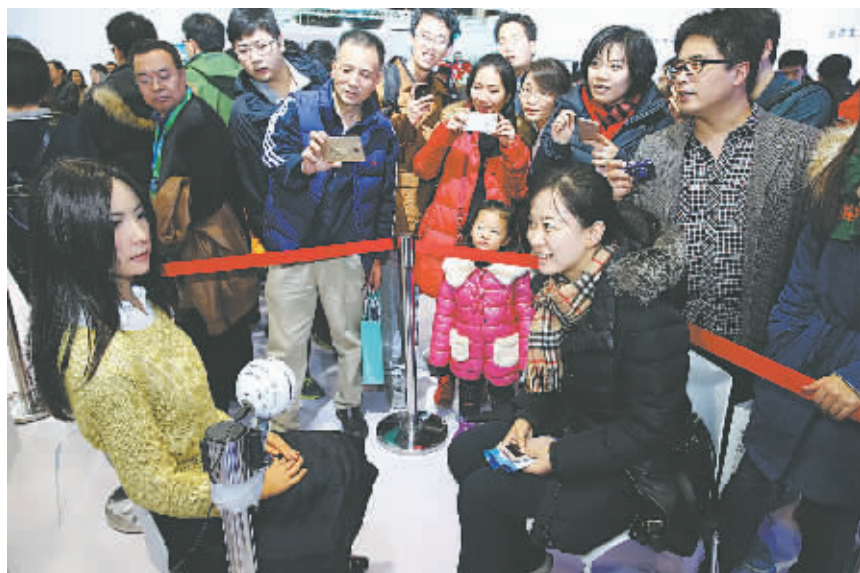
11月23日，在2015世界机器人大会上，一名参观者和情感陪护机器人进行交流。

习近平指出，本次大会以“协同融合共赢，引领智能社会”为主题，体现了各国协同创新、多学科融合共赢的发展趋势，体现了全球科技界、产业界的共识。希望各国科学家和企业家携起手来，共同推进机器人科技创新发展，为开创人类社会更加美好的未来作出积极贡献。