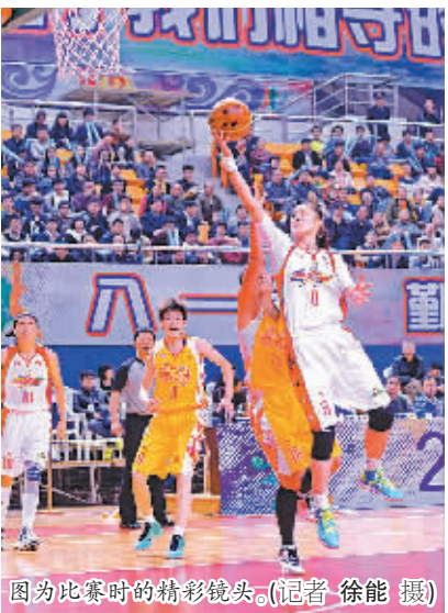
图为比赛时的精彩镜头。

76岁的顾榕塘在上世纪70年代就因工作需要涉足光影世界，从黑白到彩色，再到数码……在40多年的摄影生涯中，老顾拍过无数照片。他告诉记者，这张照片的具体拍摄时间已记不清了，只记得是上世纪80年代中期拍的，距今已有30年时间。说实话，在老顾收藏的几百幅摄影作品中，这张照片很不起眼，甚至给我们一种画面有点凌乱的感觉，可老顾非常珍惜这张照片。据他回忆，当时他拍了十几张，在自己家的暗房里冲洗以后收了起来。后来随着时间的推移，家庭的搬迁，他保存的一些照