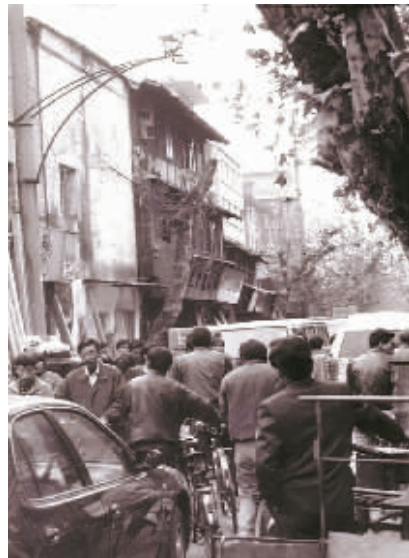
上世纪80年代的药行街。

老顾表示，在宁波街区变化中，药行街的面貌变化称得上是巨变。当年药行街沿街还有不少低矮、破旧的砖木结构老房子，很多居民还住在大杂院般的旧墙门里。而如今除了展览馆、城隍庙外，其他建筑物几乎难寻旧迹。“比如在外的天主教堂原先的位置在药行街的南侧，新的工人文化宫还没有建造。”药行街与灵桥路口交汇处还有当时宁波著名的“一百”商店。解放前开张的各式中药店，至上世纪七八十年代还留有“寿全斋”“全生堂”等，延续着药行街特有的中草药气息。此外，药行街上还有木器店、家具店、杂货店、副食品店等，像“超大大”“糕团店”“大有”“南货铺”等都是市民经常光顾的老店。