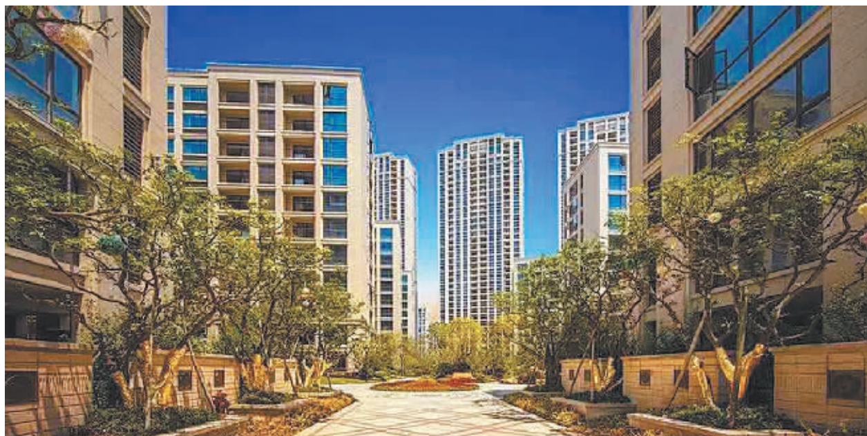
图为即将交付的荣安月园。