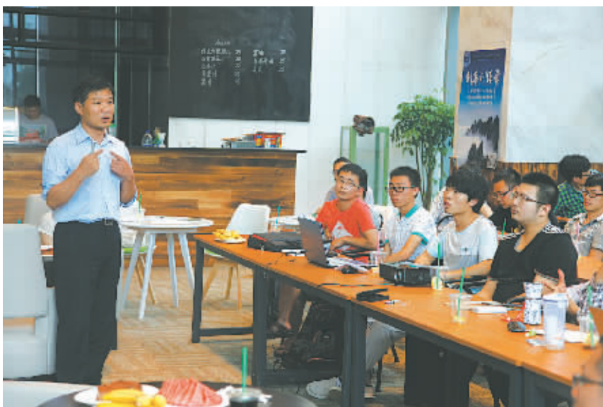
图为创客们在“创客训练营”接受创业辅导。

专家认为，国务院9月底印发的《关于加快构建大众创业万众创新支撑平台的指导意见》，是落实“互联网+”行动和“大众创业，万众创新”的政策性文件，是推进“四众”发展的顶层设计文件。《意见》提出以众创促创新、以众包促变革、以众扶促创业、以众筹促融资等重大发展方向和十七条重点举措，旨在激发全社会创业创新热情，指导“四众”规范发展，进一步优化管理服务。“四众”有利于开辟众人创富、劳动致富、共同富裕的发展新路径，对实现新常态下新旧动能的转换具有重大