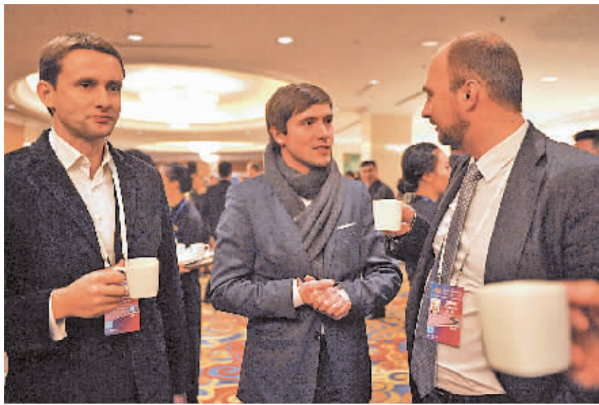
日前,由宁波承办的中国—中东欧工业园区合作论坛,吸引了不少中东欧国家客商的眼球。

——稳增长。推进区域市场一体化和城乡流通网络一体化,实现开放型经济新旧增长动力切换,推动高速增长向中高速增长平稳过渡。继续保持消费在全省的领先地位,发挥宁波外贸大市的地位作用,利用外资金力保持较快增长,“走出去”和服务贸易努力实现两位数的增长。