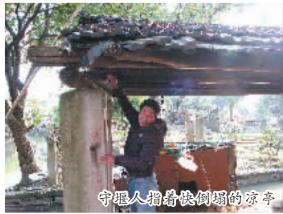
守堰人指着快倒塌的凉亭