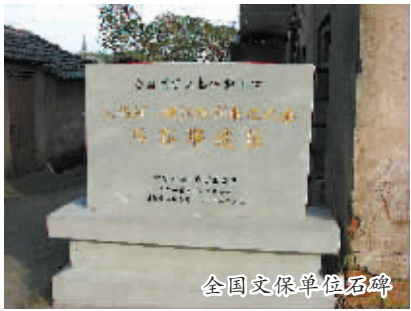
全国文保单位石碑