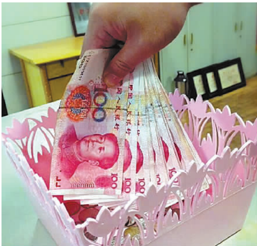
人民币“入篮”进行时。

兑换”并不是加入SDR的必要条件。比如:日元在加入SDR7年后才实现了完全自由可兑换。