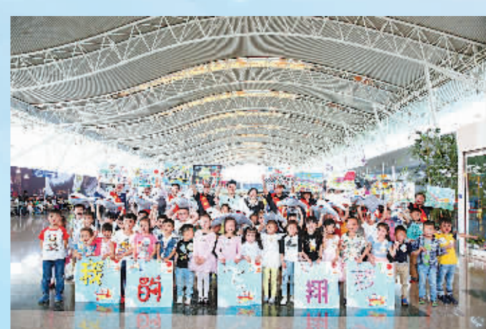
机场三期扩建得到了古林、石碶群众的支持，图为他们的孩子参加机场管委会组织的“萌娃看飞机”活动。

要实现这数个“第一”，既离不开机场与物流园区管委会的统筹协调，离不开机场集团的开拓进取，也同样离不开园区各单位的鼎力协作。五年来，宁波空港口岸服务保障能力日益提升。海关、检验检疫、边检等驻园区各联检单位，克服人手紧张的困难，坚持强监管、优服务、提效率三方并重，优化工作流程，加班加点服务口岸通关。空管、航油等保障单位，按照空港实际发展需求，克服硬件限制，全力做好空域和航油保障工作。针对日益严峻的空防安全形势，公安部门坚持实战练兵，绝不松懈，为宁波空港安全稳定提供坚强保障。各单位齐抓共管、客货运“两翼齐飞”，已经成为承载宁波空港腾飞的坚实力量。