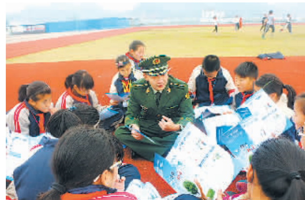
日前，宁波支队高塘边防派出所官兵走进校园，开展禁毒宣传教育活动。边防官兵采取知识问答的形式，并结合近期发生的公众人物吸毒产生不良影响的案件，向学生讲解吸毒对个人、家庭和社会带来的危害，进一步提高学生防毒、拒毒、禁毒意识。图为：在象山县高塘学校操场，同学们正聆听边防官兵讲述毒品的危害。

近年来，东海舰队某防救船大队党委高度重视驻地学校的军训工作，将其作为支援地方教育事业的责任义务，连续10余年为驻地学校搞好军事训练，增进了沟通了解，密切了军民关系。