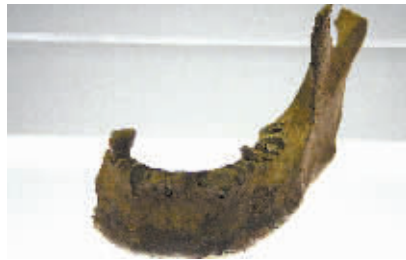
人下颌骨(河姆渡文化)

鱼山遗址发掘时，局部揭露出一处保存较好、布局清晰、功能明确的居住生活区，发现了排桩、汲排水沟、柱洞群、木构栈桥、砂土台、食物储藏坑、蓄水取水坑和垃圾填埋坑等生活遗迹260余处。出土的遗物主要有泥质陶器、釜、罐、钵以及印纹硬陶碗、瓮、提梁壶，原始青瓷豆、碗等生活用具，铜斧、铜镞和石斧、砺石等生产工具与狩猎武器。印纹硬陶与原始青瓷质地坚硬、造型优美、纹饰多样，青铜器锡、