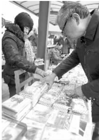
“连友”在交流大会上“淘宝”。