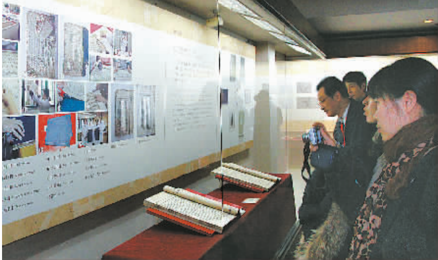
图为来宾参观展示的修复古籍。