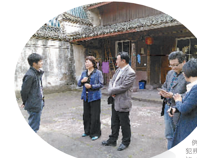
政协委员参加视察活动。