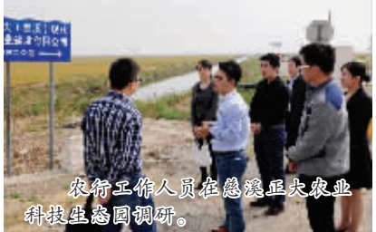
农行工作人员在慈溪正大农业科技生态园调研。

农行余姚支行与宁波天邦股份有限公司有10余年的合作关系,积极支持企业发展壮大。该行为企业量身定做综合金融服务方案,根据企业今后发展需要