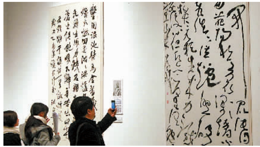
图为昨天市民在宁波美术馆观看行草十家展。

本报讯(记者陈青 通讯员韩琳)由中国书法家协会展览部主办的“典翰翰歌——行草十家展”昨日在宁波美术馆开展,展览汇集了浙江、安徽、广东、河北、河南、山东、四川等地9位著名书法家的作品。