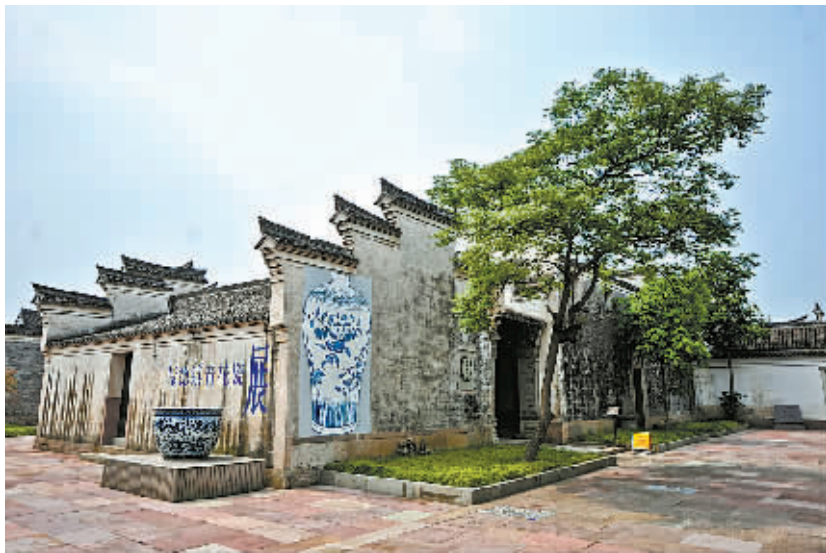
卫星城建设让慈城更有韵味。

产城融合，培育经济增长点。按照“产业培育特色化、特色产业集聚化”思路，试点镇积极推进转型发展、集约发展，促进传统块状经济向现代产业集群转变，探索各具特色的发展之路。目前，周巷、观海卫、石浦、集士港等卫星城产业集群化发展态势已经形成。