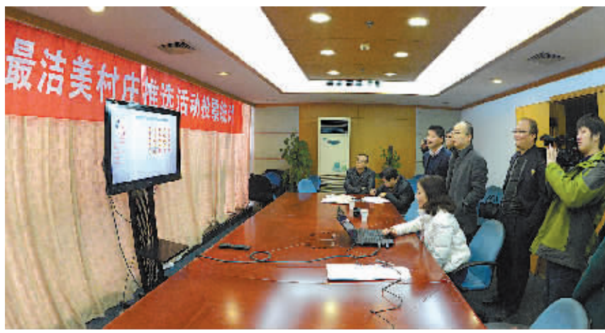
幸运读者网友抽取现场。

“村容改造是为了吸引游客,游客多了,村民的实惠肯定会更多,以后大家都会自觉爱护美丽乡村。”掌起镇相关负责人认为,拥有天然“负离子空调”的任佳溪村有得天独厚的条件进一步做好“卖空气”和“卖风景”的文章,以良性循环为村庄带来发展新机。