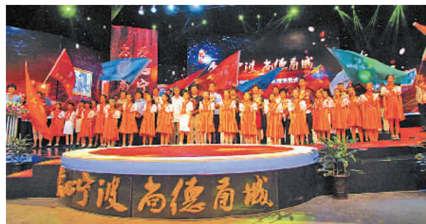
宁波市第四届道德模范颁奖仪式现场。