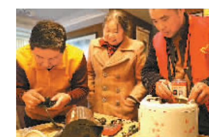
党员志愿者送修上门。

每位参加“先锋e号”的在职党员志愿者还在平台上认领了自己的奉献岗，通过开展夜间巡逻、周末清洁家园等活动，主动参与平安、文明社区建设。现在，社区“先锋e号”每月开展一次广场志愿服务活动，提供维修家电、缝补毛衣、测量血压、健康金融咨询等服务，目前已累计服务1000多人。