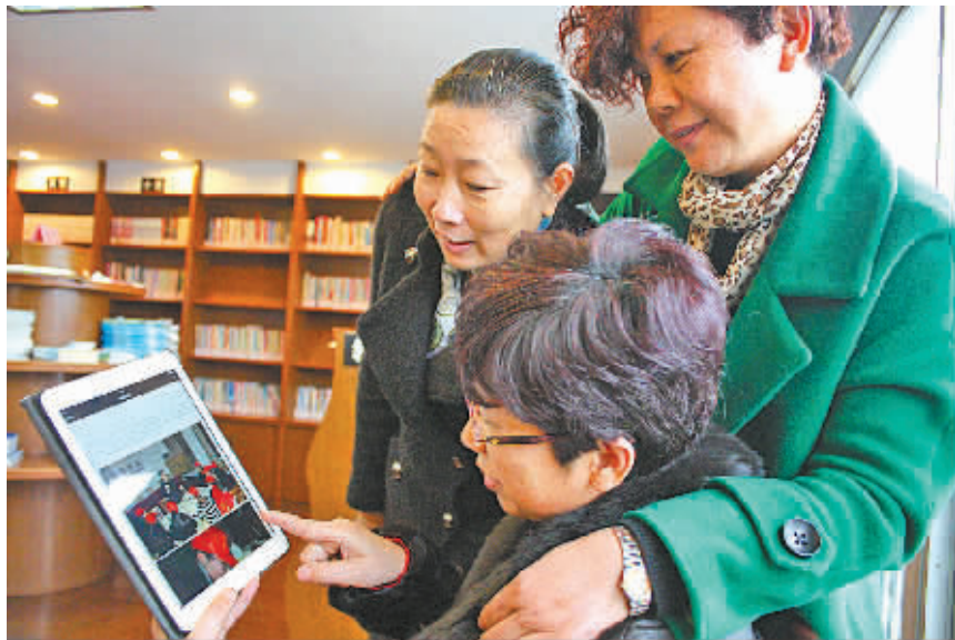
大树社工正在为居民介绍微信服务新功能。

海湾社区是大树最大的社区，9个社工管理14万平方米，服务5784名常住居民群众。“人少活多是社区工作的共性问题，最好的办法就是能把居民群众动员起来，让他们自我管理、互相服务。”社区工作者胡群告诉笔者：“八小时外的管理服务也是