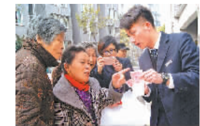
何辨别新版人民币的真假。

福明街道碧城社区有条金融街，云集了8家银行10余家理财公司。为帮辖区内居民特别是拆迁安置户合理理财、规避投资风险，福明街道碧城社区党支部整合辖区金融单位资源，请党员志愿者“抱团”为居民上门理财。到目前为止，这支“金融志愿者服务队”已为6个小区的3000户居民提供了十余场服务，内容包括“散钱兑换整钱”“真假币识别”“P2P理财风险”等。图为志愿者在教居民如