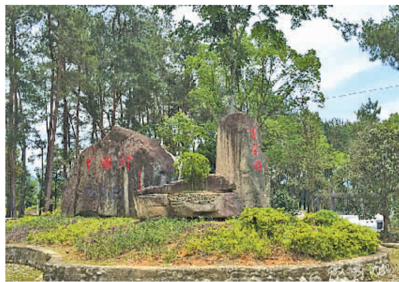
下畝村慈孝园。(王博 孙吉晶 摄)

“雨后新霁晴，泉声山色，往复幽变，翠丛中山鹤映发。”早在400多年前，徐霞客就对这里给出了如此高的评价。未来，这座“世外桃源”将被打造成一个集休闲、养生于一体的养老中心，提供1000张床位，让更多老年朋友享受“好山好水好风光”。