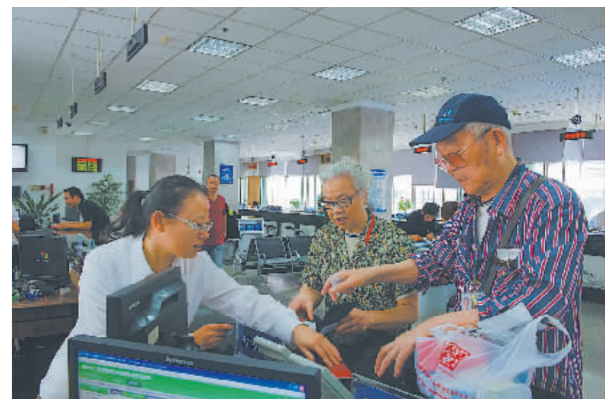
市民在办理医保咨询业务。

被称作“民生之依”的社保同步前行。记者了解到，“十二五”以来，从职工医保到城乡居民医疗保险，从城镇职工养老保险到城乡居民养老保险，我市已基本建成覆盖城乡全体居民的社保体系，实现了养老、医疗等社会保障制度全覆盖，我市社保待遇也在不断提高。过去5年间，我市退休职工养老待