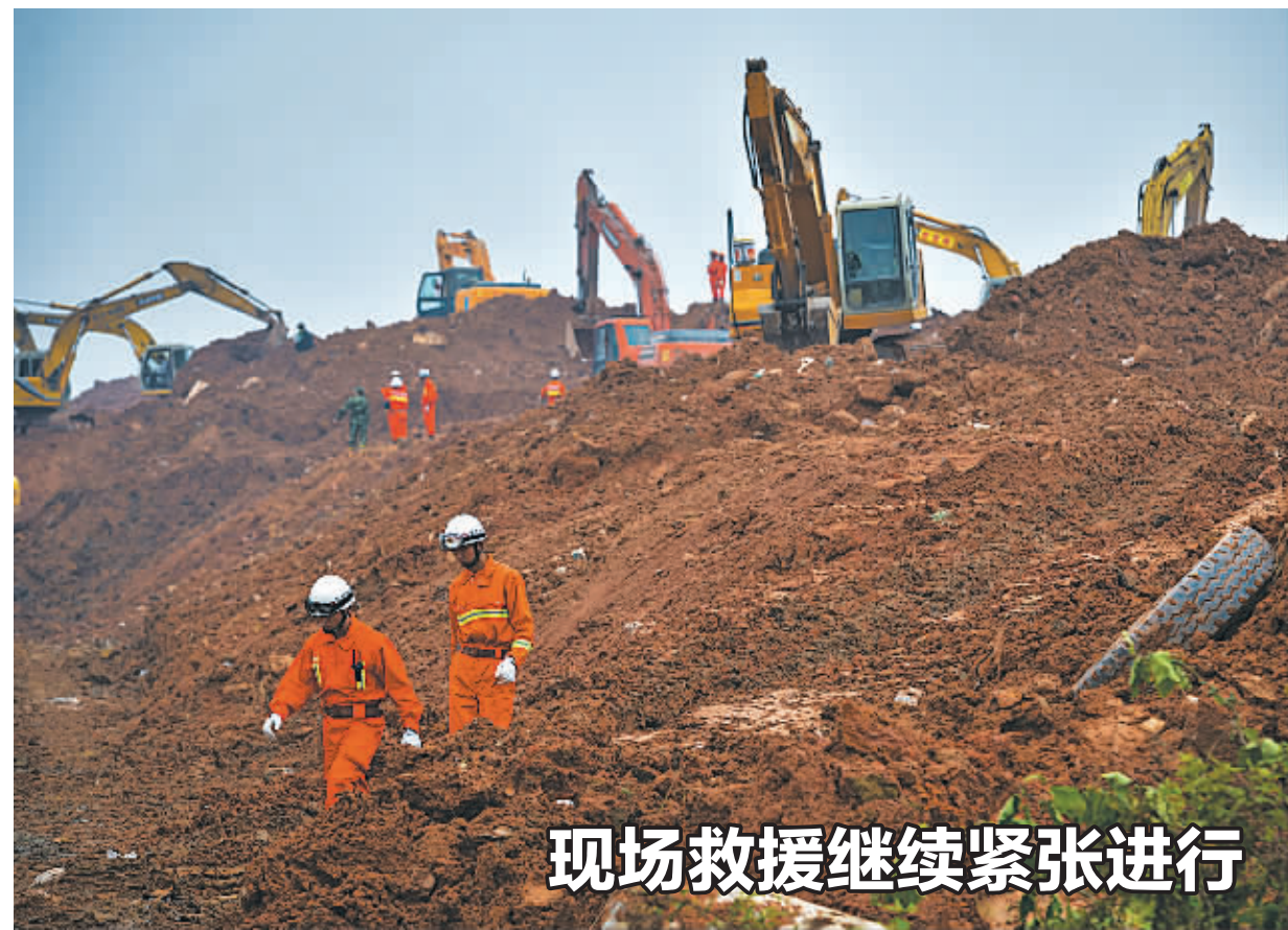
12月21日，救援人员在深圳山体滑坡现场使用机械进行搜救。

救援人员的生命安全。21日凌晨3时，现场指挥部决定将灾害现场调整为机械加人工网格式搜救，调用78台挖掘机从不同方向展开大规模挖掘，同时组织1200名消防、武警和公安民警配合开展搜救工作。搜救过程中，中石油抢险队已对山体滑坡区域受损的400米管道进行了氮气吹扫，排空管内残留的天然气，21日上午开始修建临时管道。