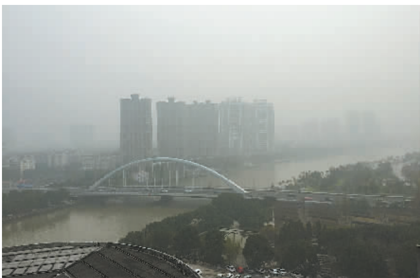
昨天,全市空气污染达到五级重度污染。

环境专家也建议,当空气质量出现重度污染时,儿童、老人和心脑血管、呼吸系统疾病患者等易感人群尽量留在室内,避免晨练等户外运动;中小学、幼儿园停止室外活动;公众减少户外运动和室外作业时间。