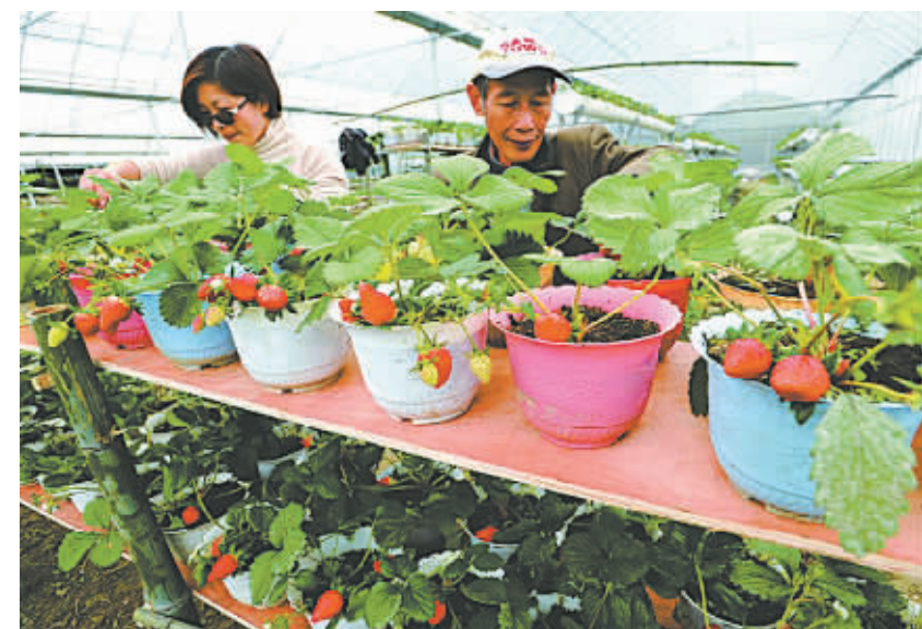
好吃又好看的盆栽草莓。

本报讯(记者徐欣 通讯员张礼兵 许鑫)记者昨天在奉化市尚田镇冷西村的草莓种植基地了解到,今年地产草莓产量减少四成,价格也比上年高了不少。但随着第二批草莓的上市,预计半个月后草莓产量会逐渐增加。