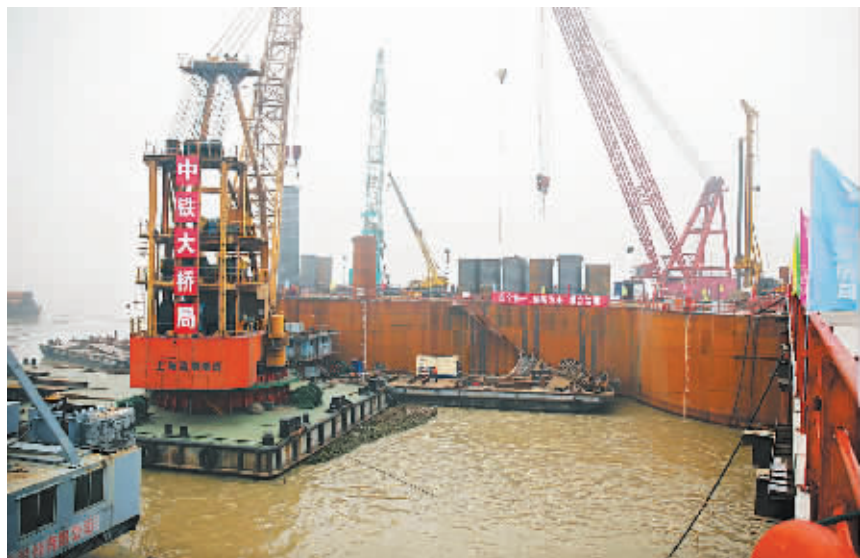
武汉青山长江大桥施工现场 (12月23日摄)。12月23日，武汉市青山长江大桥开工建设，这是武汉市的第11座长江大桥。武汉青山长江大桥位于天兴洲长江大桥和阳逻长江大桥之间，属于在建的武汉四环线东段控制性工程。大桥设计全长为7548米，预计2019年基本建成。