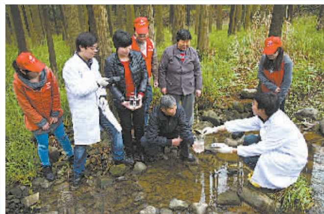
市民走访皎口水库生态湿地