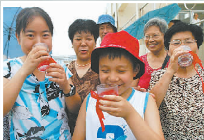
市民品尝清纯甘冽的白溪水