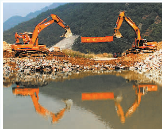
钦寸水库围堰截流