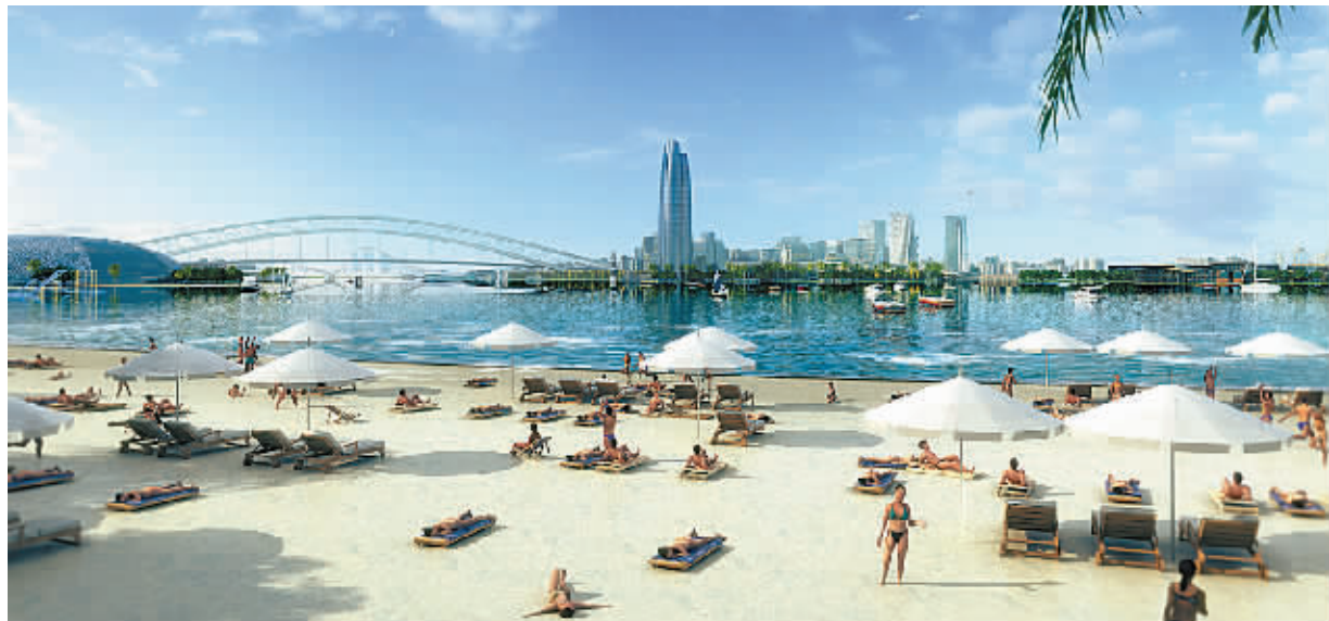
宁波滨海万人沙滩项目效果图。

近年来,梅山举办过一些大型体育赛事。2013年,X-CAT摩托艇世界锦标赛在梅山举行,8个国家的13支代表队参赛,全球300多家媒体进行了赛事转播。“去年国务院出台了关于加快发展体育产业促进体育消费的若干意见,提出大力推动专业赛事发展,打造一批有吸引力的国际性、