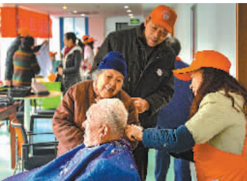
12月28日上午,江北区老干部“银辉”志愿服务活动走进慈城步轮益寿院,为养老院的老人提供理发、医疗、二胡演奏、陪聊等志愿服务,并为老人们送去围巾、护手霜、牙膏等物品。江北“银辉”志愿者队伍由500余名离退休老干部组成,旨在发挥余热,帮助他人,快乐自己。