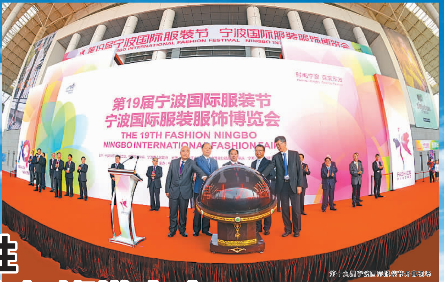
第十九届宁波国际服装节开幕现场

围绕“区域性国际会展之都”的建设目标，我市会展业疾步前行，在总量规模、质量效益、平台建设、主体队伍等方面全面开花。2012年至2015年，我市四大专业展馆（宁波国际会展中心、慈溪国际会展中心、余姚中塑国际会展中心、宁海国际会展中心）办展数量保持年均25.7%的增长，展览总面积以年均8%的速度平稳增长。