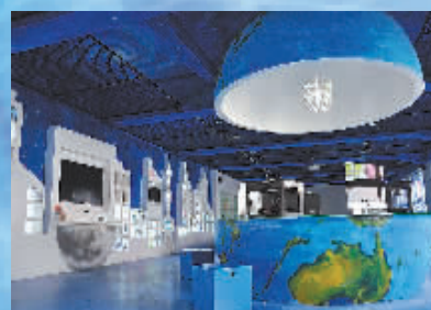
2014年12月12日，江东中心小学“圆梦中心”科技体验馆开馆，该馆以3D体验和打印项目为核心内容，是目前宁波小学中规模最大的科技体验馆。