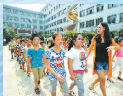
2014年8月28日，江东区外来务工人员子弟学校搬入新校舍。