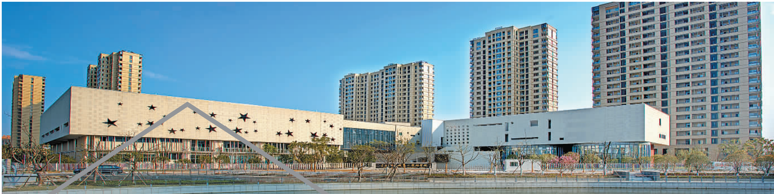
2015年9月，新城第一实验学校新校区建成开学。