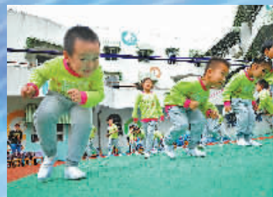
宁波市第三幼儿园园丁分园的一群小朋友正在参加皮筋操游戏。