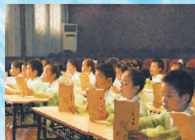
2015年，宁波市镇安小学荣获“全国未成年人思想道德建设先进单位”。