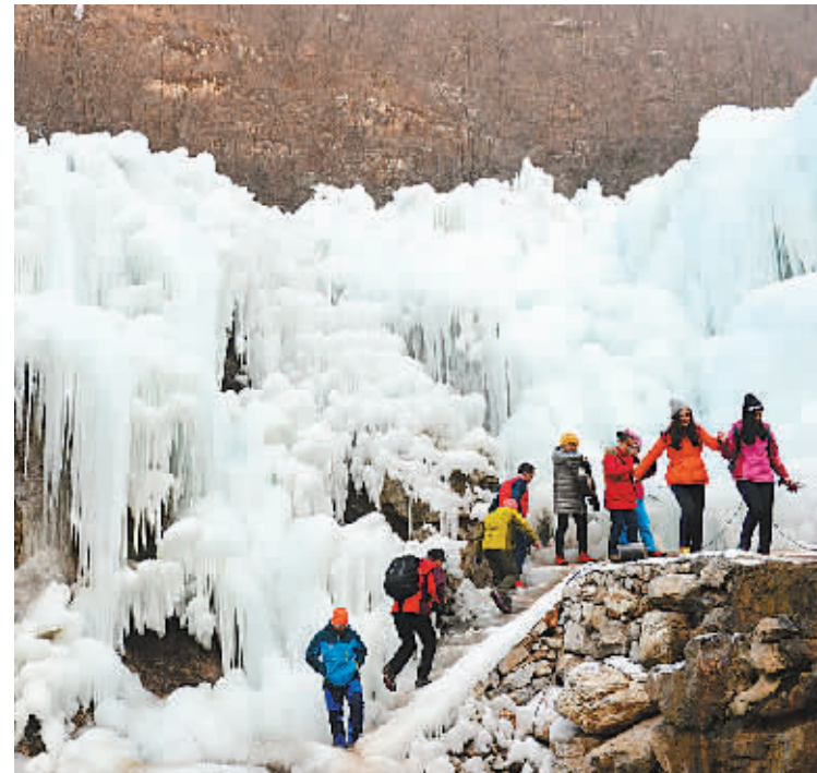
1月3日，游客在平顺县龙居生态风景区观赏冰瀑景观。进入冬季，地处太行山深处的河北省平顺县龙居生态风景区形成独特的人工冰瀑景观，形态奇特、晶莹剔透的冰瀑奇景蔚为壮观，吸引了众多游客前来观赏游玩。