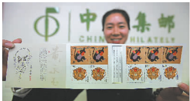
图为工作人员展示邮票。