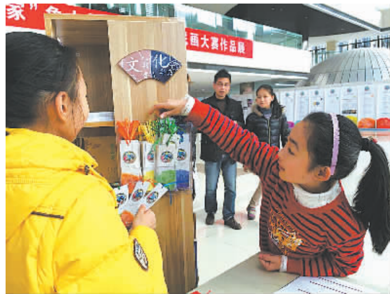
创意书签颇受青睐。

民乐、京剧、越剧、原创音乐会四场演出,象山文化活动中心可容纳758人的剧场场场爆满,甚至连过道、走廊也站满人。越剧《梁秋雁》演出时,许多观众手捧鲜花入场,全场无一人离开;京剧专场《中华神韵》,吸引了杭州等异地票友慕名专程赶来。“现在看这样演出的机会越来越少,城区演过了,可别忘了来我们农村呀,我还想再