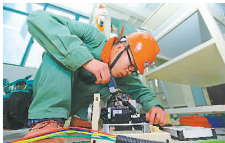
2016年宁波市中等职业教育技能(才艺)大赛在全市各地打响。本次大赛共设创业计划书、书法、文秘、职业生涯规划88个竞赛项目,来自全市38所中职学校的2857名师生在16个赛点参加比拼。图为昨天上午在鄞州职教中心分赛场举行的电子电工项目比赛。