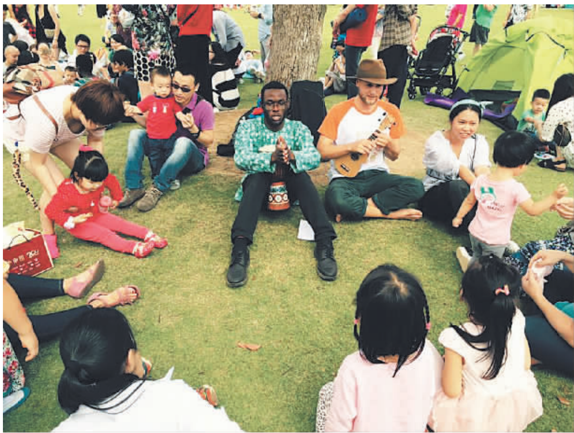
宁波诺丁汉大学的国际生与社区居民共度周末。