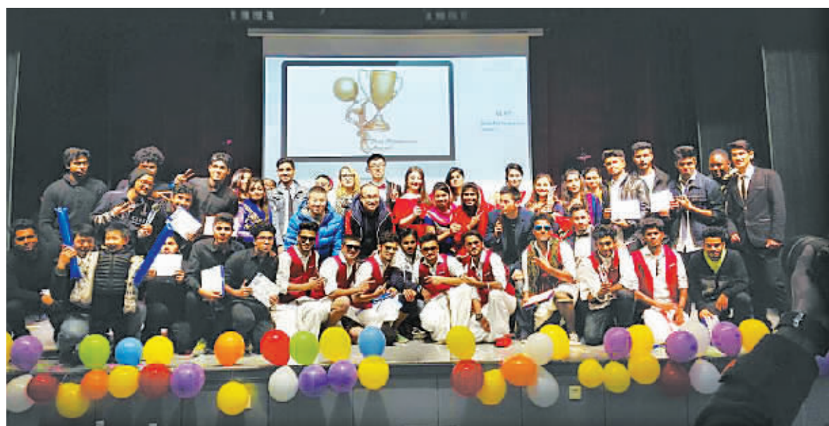
宁波大学国际生进行才艺表演后合影。

目前，中国政府正在积极实施“留学中国计划”。到2020年，来华留学生数量预计达到50万人，中国将成为亚洲最大的留学目的国。