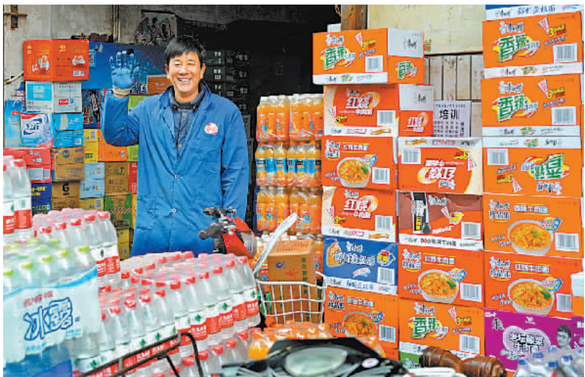
“新市场见!”近日,宁穿路二号桥市场内,一经营户与老主顾热情地打着招呼。