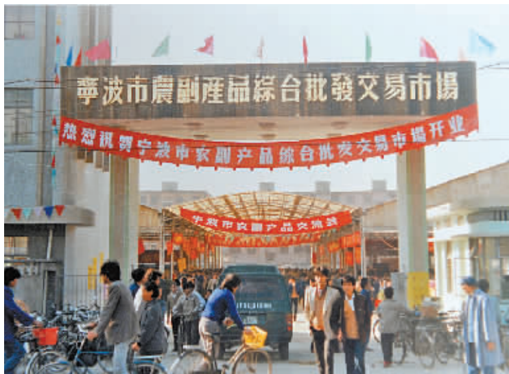
1989年,二号桥市场热闹开业。

屈指数来,二号桥市场与宁波人相依相伴了26个年头。26年来,孩童们用着这里的铅笔和作业本,修完了十几年的学业;年轻人发着这里的喜糖喜烟,走进了婚姻的殿堂;老人们踱着缓慢的步伐,搜索着过往生活的记忆。26年来,二号桥市场也在成长,相继获得了“宁波市重点商品市场”“浙江省区域性重点商品市场”和“浙江省百强市场”等荣誉称号。目前,二号桥市场累计有经营摊位1000多个,年交易额超过10亿元。