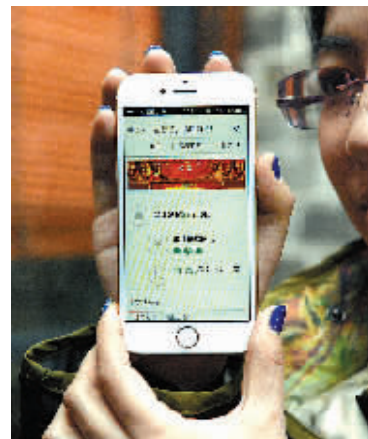
善园公益基金会工作人员展示相关数据。

从去年3月起,围绕信义、忠义、孝义、道义、善义、节义等“义文化”内涵,鄞州区全面开展讲好“义”故事、搭建“义”平台、设立“义”基金、扩大“义”队伍、开展“义”行动、表彰“义”人物、推广“义”形象等7个大系列22项活动。