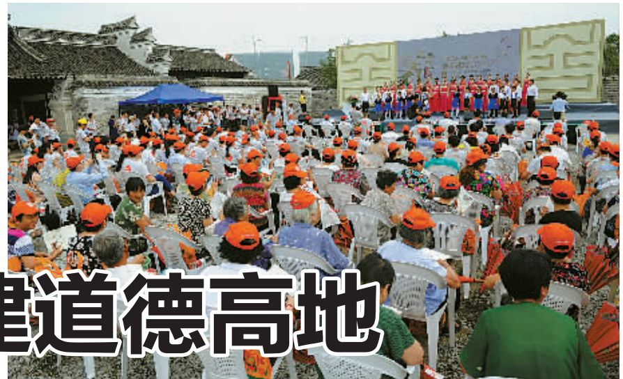
善园奠基仪式现场。

的精神丰碑。在全国征集“义乡鄞州”LOGO和形象标识,收到主题口号投稿1万余条、形象标识近百个,最终确定“千年义乡·厚德鄞州”为主题口号。唱响《义乡鄞州》主题曲,免费发放《我在鄞州——鄞州市民手册》5万余本。《光明日报》《浙江日报》、人民网、中国文明网等中央、省、市主流媒体纷纷报道。