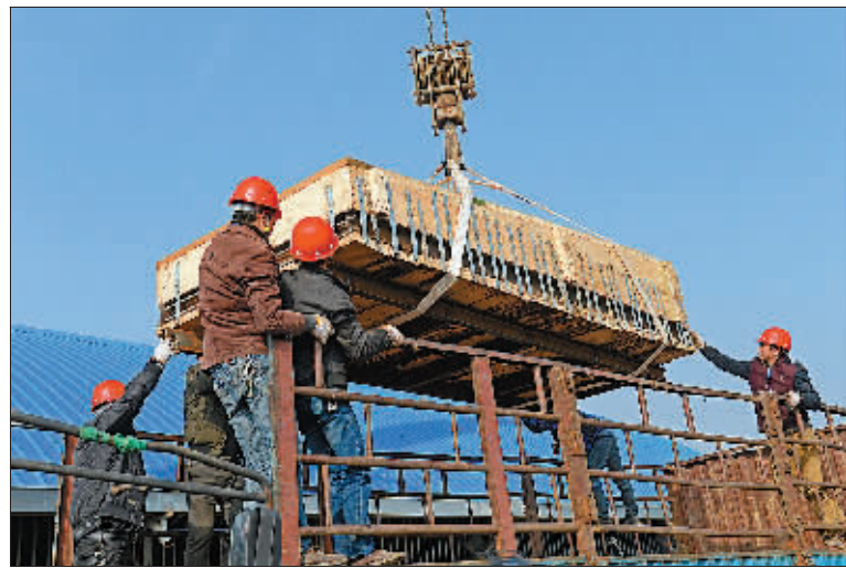
图为1月15日,工作人员在吊装主棺柩套箱。

功能布局最清晰、拥有最完备祭祀体系的西汉列侯墓园,并于12日入选由中国社科院主办的2015年“中国六大考古新发现”评选。