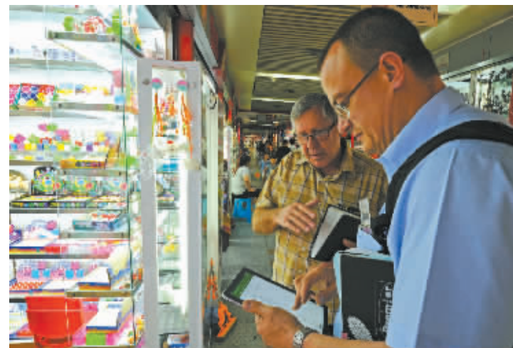
据杭州海关最新公布的数据显示，浙江省2015年出口17174.2亿元人民币，同比增长2.3%。这是两位南非客商在浙江义乌国际商贸城核对小商品采购清单(2015年7月19日摄)。