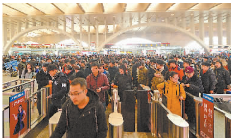
1月17日，旅客在石家庄火车站检票进站。2016年全国铁路春运将于1月24日开始至3月3日结束，目前石家庄火车站、石家庄客运段通过优化运能配置、推出便民措施等备战春运，确保春运期间客运平稳安全运行。(新华社发)

分用户、长命桥、日吉巷、朱界经济合作社、华光精密铸造厂、联诚不锈钢、谷鼎铝业、中直农业、电子元件厂、活塞厂、特种活塞环、洪塘包装、邵家渡村部分用户、中远钢铁(8:30-16:30,短时停电,遇雨取消) 1月29日 星期五 江北区 宁大高配 5001041633(8:30-16:30) 停电预告补充： 取消： 1月19日 星期二 江北区 石浦饭店、设计师、计量所、马衙街一带停电(8:45-16:00) 1月22日 星期五 海曙区 海城投资、鄞奉路一带部分用户停电(9:00-16:00) 增加： 1月18日 星期一 杭州湾新区 管理委员会、开发建设、诺顿园林建设有限公司、浙江复能新材料科技股份有限公司、中国移动慈溪分公司、现代农业开发、海涂围垦开发、部分双瑞水产(8:30-11:30) 1月19日 星期二 杭州湾新区 华德汽车装备、方大厨具、开发建设管理委员会(8:30-11:30) 1月21日 星期四 海曙区 气象路雨润路交叉口附近、梁安中学、建筑设计院、送变电停电(9:00-16:00) 江北区 鑫奥汽车、国奥达汽车、上金地(8:30-16:30,遇雨取消)联谊密封件厂一带(8:00-16:30) 杭州湾新区 利海贝尔、大自然新型建材有限公司、汇龙织染有限公司、精雕数控(8:30-11:30)浙江慈溪经济开发区管理委员会、浙江联合通信有限公司、人和新能源科技有限公司、慈能光伏有限公司、塞纳电热电器有限公司(13:30-16:30) 1月22日 星期五 杭州湾新区 华德汽车零部件、天鸿钢结构、艾迪雅科技有限公司、中国铁路有限公司、利山紧固件、海盐真空技术开发有限公司、统一长毛线、浙江慈溪经济开发区管理委员会、中国移动(8:30-11:30)阿伍渔业、庵东水产养殖、中国移动(新区北汇梁)管委会水泵站、慈溪水利局、马干村部分用户、陆陆村部分用户、三灶五金配件厂、文翔电器、申彦塑料模具、东一幼儿园、富达汽车配件厂、基督教堂、宁波耐吉钢结构有限公司、林波电子器材厂、耐吉高压开关厂、亚达琪洁具、仁栋电气、奇士电器、吉驰机械、万成钢结构、友道智研、益旗塑料模具厂、东鑫机械、杭鑫液压元件、旭伟电子、益成电器、中兴一路、庵东镇人民政府(13:30-16:30) 国网宁波供电公司 网址:95598.zj.sgcc.com.cn