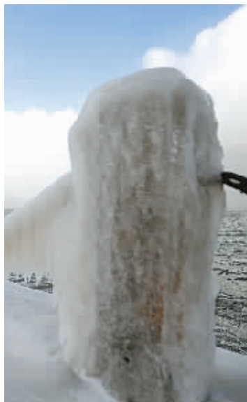
1月19日，烟台旅游大世界码头的护栏上挂满海水冰凌。当日，烟台气象台发布道路结冰黄色预警信号。