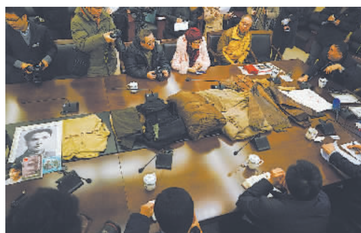
1月19日，侵华日军南京大屠杀遇难同胞纪念馆获得由抗战老兵家属和四川抗日老兵救助会捐赠的包括全套“飞虎队”飞行员服装、抗日老兵手印、缴获的日军军官衬衫在内的各类史料200余件。截至目前，纪念馆在全世界范围内共征集到各类藏品17万余件。图为捐赠仪式现场。