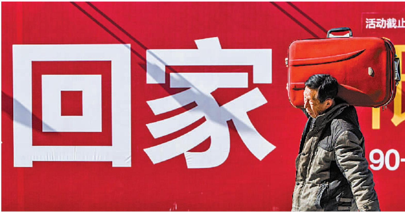
1月24日，在河南信阳东火车站，旅客准备进站乘车。当日，为期40天的2016年春运正式拉开大幕。