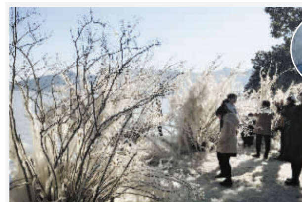
东钱湖韩岭山村环湖东湖湖滨