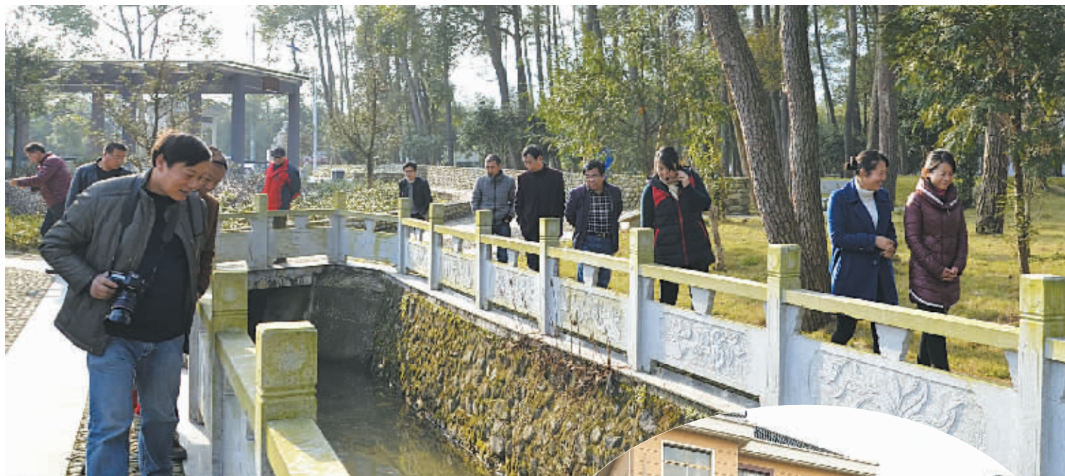
观察员在宁海下岞村实地走访。