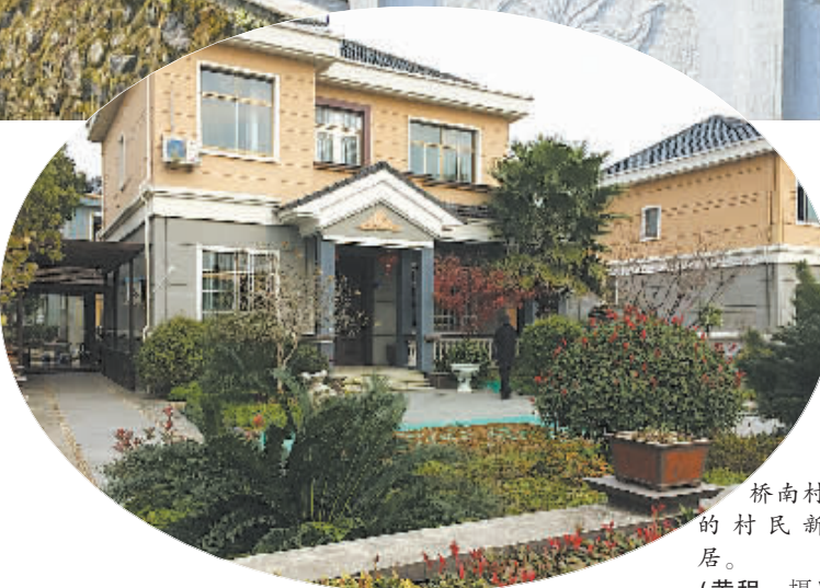
桥南村的村民新居。

我市很多村庄靠近中心镇或市区，处在城乡接合部，外来人员较多，给管理带来很大的难度。但村里的党员干部有清晰的思路 and 强大的凝聚力，经济发展得红红火火，村庄管理得井井有条。江北区的鞍山村、邵家渡村和余姚的天华村、镇北村、汪巷