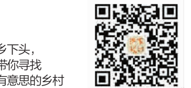
乡下头，带你寻找有意思的乡村