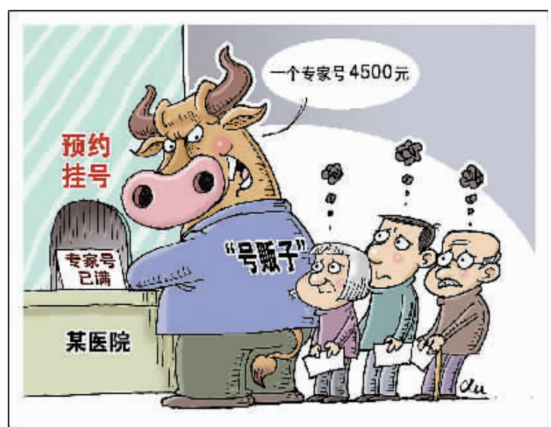
“号”劫 新华社发 徐骏 作

难”，稀缺矛盾造成了“黄牛”泛滥。北京市卫生计生委委员高小俊介绍，截至2015年7月，北京市共有146家医院接入北京市预约挂号统一平台提供预约挂号服务。但是，目前北京市预约挂号统一平台提供号源的整体预约率还不到30%，也就是七成以上的号源并未约出，其中大多是普通号和专科号。号源全部约满的情况，集中出现在知名医院知名科室的高职称专家号上。